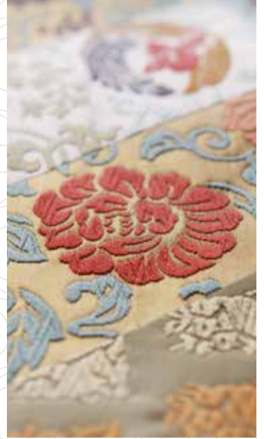
能装束・帯地 (製造: 渡文株式会社)