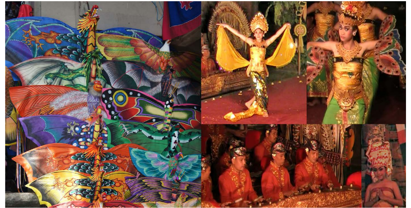
「バリ島伝統舞踊、凧、ガムラン音楽/撮影：中島信貴」 インドネシア・バリ島の芸術は極彩色に満ちている。伝統舞踊(レゴンダンス、パロンダンス、ケチャックダンス等)の衣装、仮面、凧、彫刻などに、生命力あふれる「色」たちが息づいている。それらはガムランの音たちと響きあい、独特な宇宙を創り出している。本作では、そんな極彩の色を介して幻の女神と戯れる幻想体験を目指した。

室橋直人・デザインプロダクションに入社し、雑誌広告からポスター・アパレル・不動産関係のグラフィックデザイン・WEBデザイン・アートディレクション等を行う。 その後3DCGを学びデザインに活かしながら、専門学校や大学でゲーム向けの3DCGを中心としたデザインワークの講師を務める。現在、東京工芸大学芸術学部ゲーム学科デザイン分野助教。ゲームCG(モデリング・モーショ)教育を行う。日本デジタルゲーム学会会員。