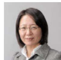
よしまさこ・横浜国立大学経済学部卒 在学中より35年に渡りマンガ家として活躍。代表作に「うてなの結婚」「横浜迷宮」など著書、海外翻訳本多数。