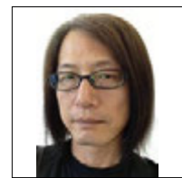
酒井孝彦・東京造形大学造形学部デザインI類写真コース卒 現代美術家協会委員 私立情報教育協会委員 日本広告写真家協会員 個展多数。